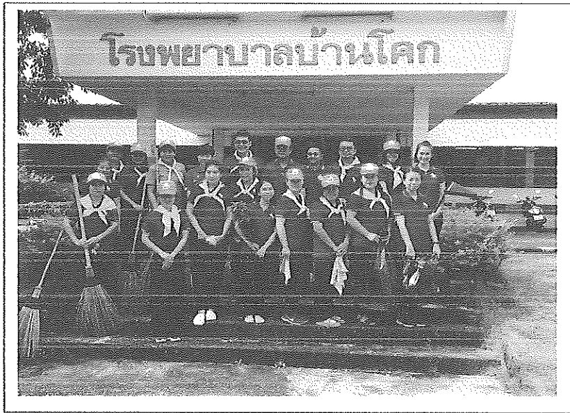
กิจกรรมจิตอาสาพัฒนาโรงพยาบาลและชุมชน