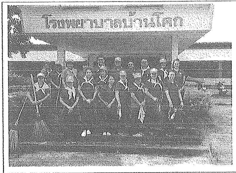
กิจกรรมจิตอาสาพัฒนาโรงพยาบาลและชุมชน